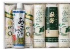
●「あらぎりわさび」の賞味期限は発送日より冷蔵にて120日 (仕入れ状況により賞味期限が異なる場合があります)