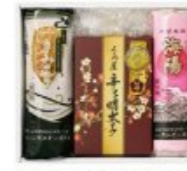
●「味噌明太子」の賞味期限は発送日より冷蔵にて10日