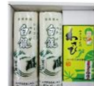
●賞味期限は「白銀」は自産日より冷蔵にて14日、「わさび漬」は自産日より冷蔵にて3週間