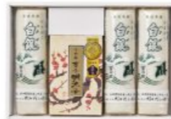
●「辛子明太子」の賞味期限は発送日より冷蔵にて10日